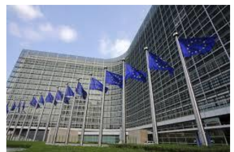
Die europäische Kommission in Brüssel

Die Europäische Union ist eine Gemeinschaft der Freiheit, der Demokratie, der Menschenrechte, der sozial verpflichteten Marktwirtschaft und der kulturellen Vielfalt.